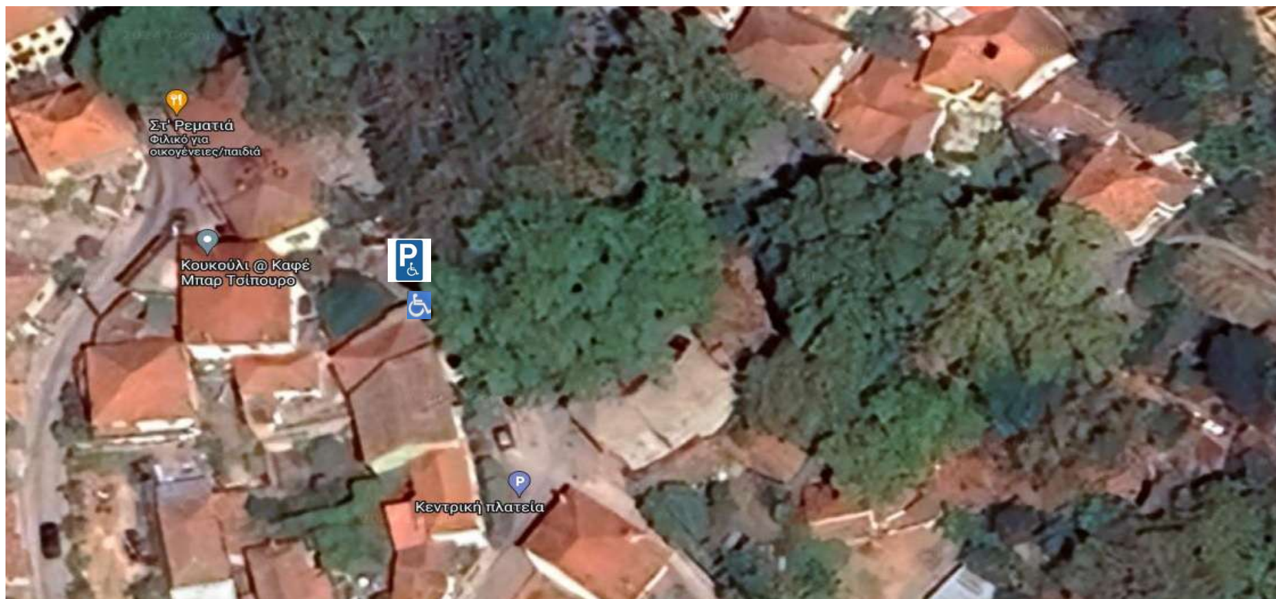
Θέση Πλατεία Μεταχωριού, ράμπα ΑΜΕΑ, 1 θέση στάθμευσης.