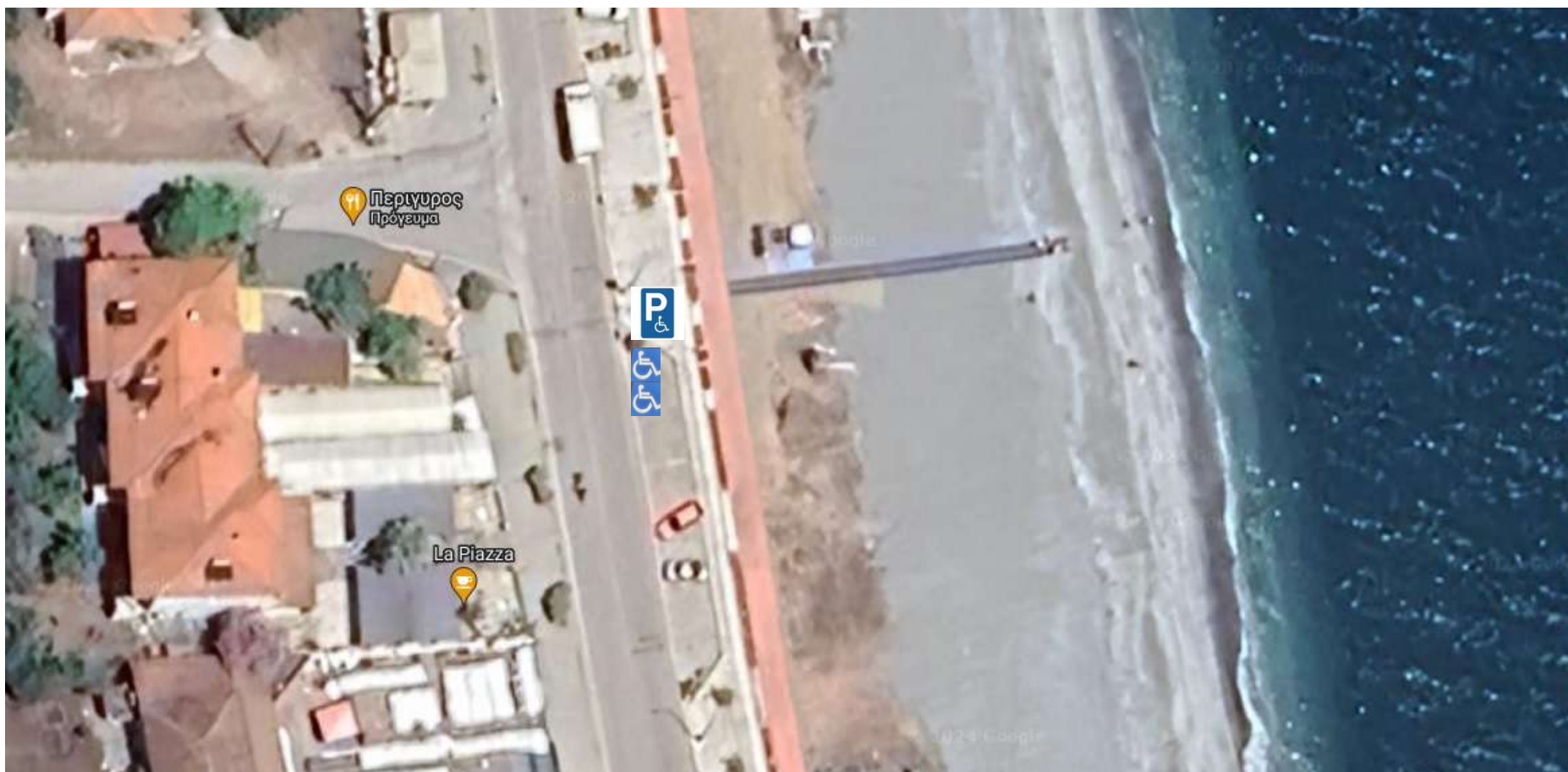
Θέση «Παλιό Περίπτερο» Βελίκας διάταξη ράμπας ΑΜΕΑ, 2 θέσεις στάθμευσης.