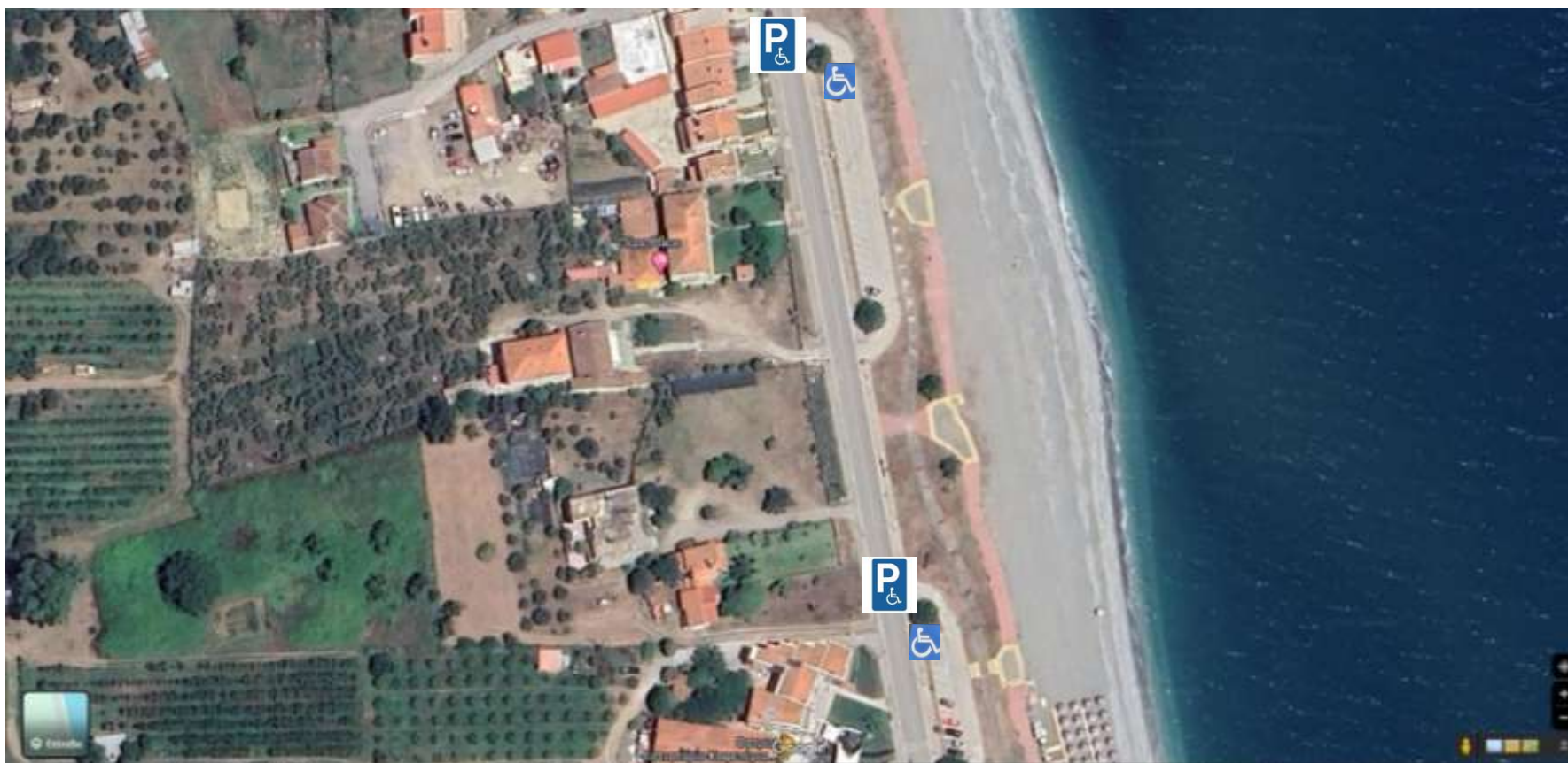
Θέσεις Αναπλάσεων Κ.Σωτηρίτσας, 3 θέσεις στάθμευσης.