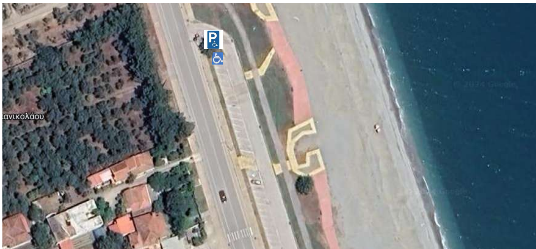
Θέση «Ανάπλαση» Αγιοκάμπου, 1 θέση στάθμευσης.